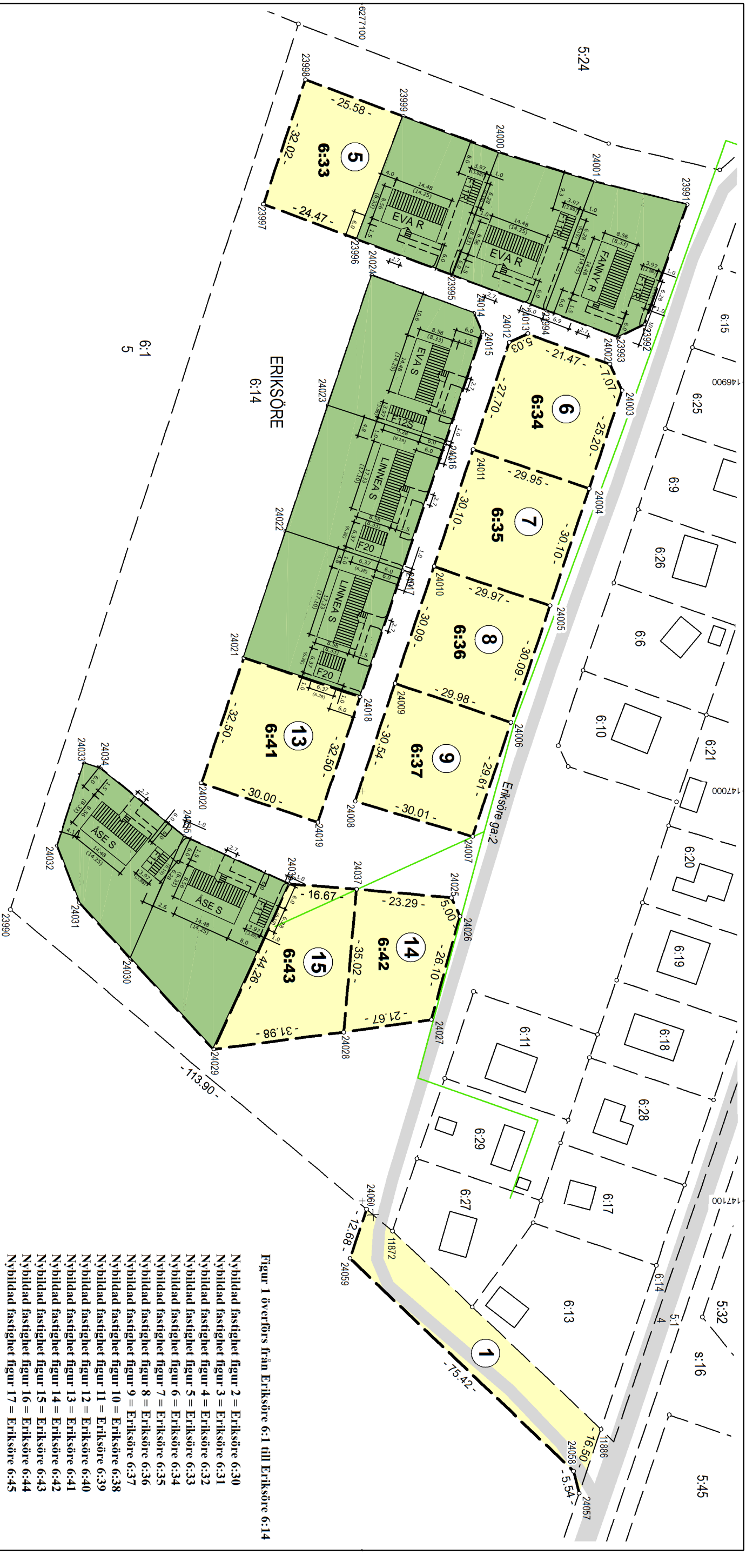
Figur 1 överförs från Erikssöre 6:1 till Erikssöre 6:14